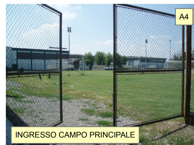
INGRESSO CAMPO PRINCIPALE