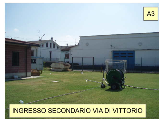
INGRESSO SECONDARIO VIA DI VITTORIO