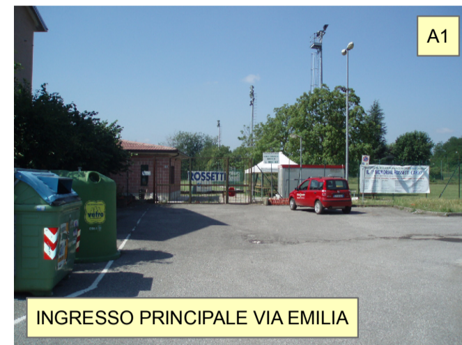
INGRESSO PRINCIPALE VIA EMILIA