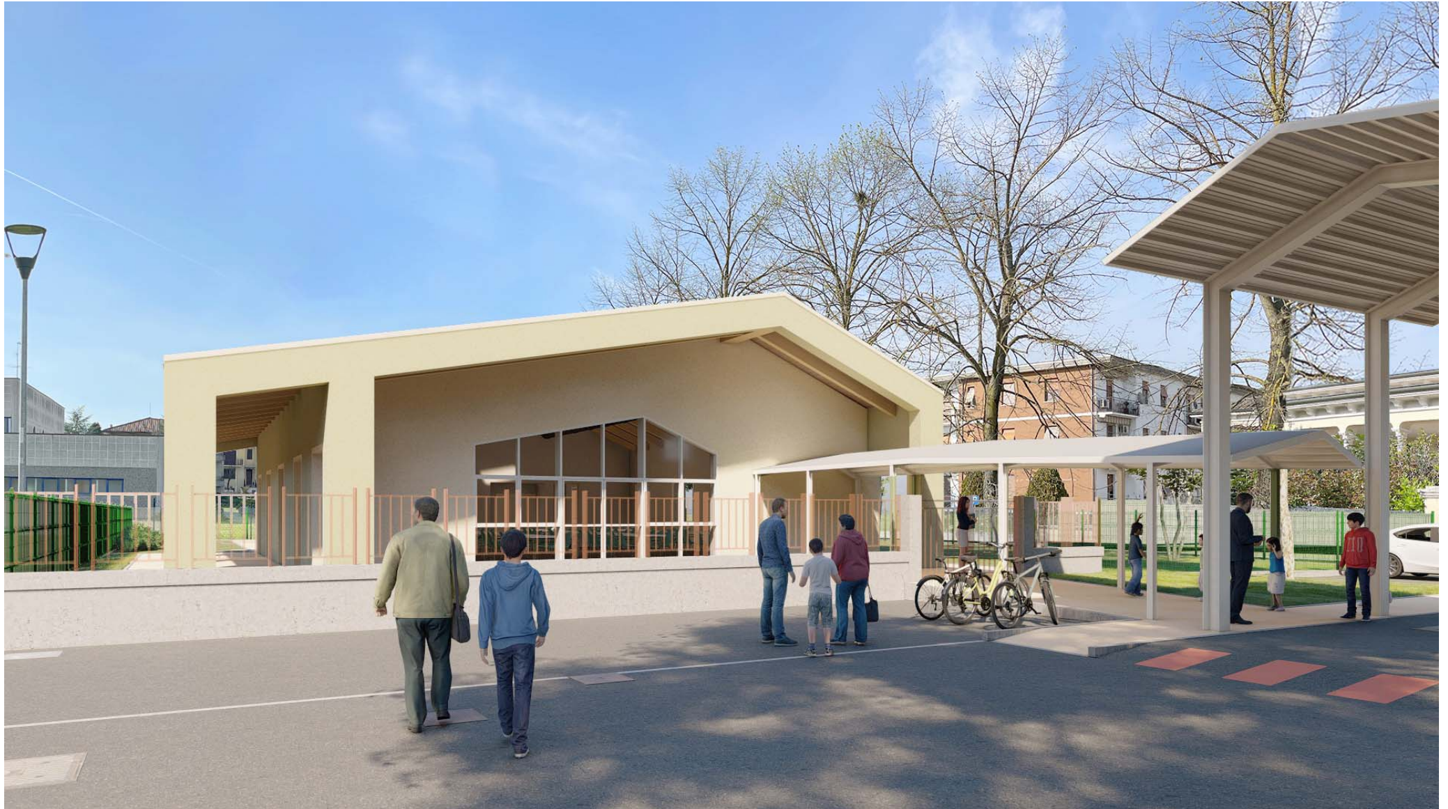
FIG 1 VISTA OVEST FRONTE PRINCIPALE